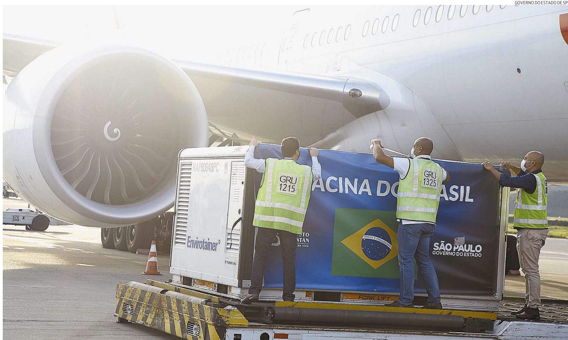
O Butantan recebeu, ontem, 600 litros de matéria-prima para produzir um milhão de doses da CoronaVac em solo nacional. O material será envasado em frascos multidoses